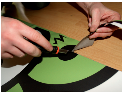
Začátek ořezávání. Je dobré samolepku oříznout co nejtěsněji u prkna.