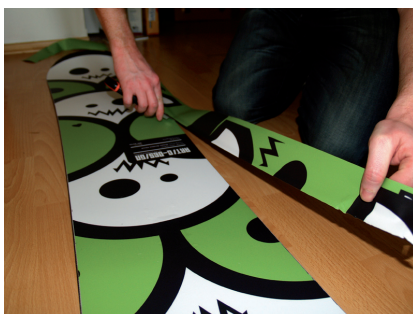
Doladění ořezu. Zarovnání hran.