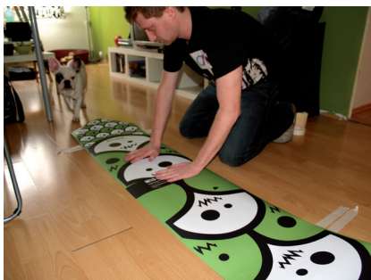
Deska je přilepená lepenkou a samolepka je vystředěná na snowboardu.