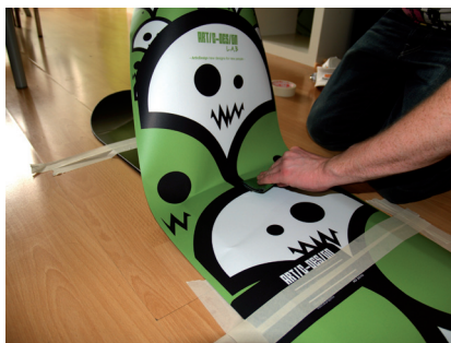
Přilepení středu samolepky k snowboardu a postupné odlepování silikonového papíru.