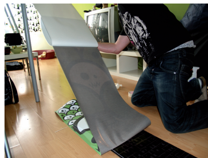
Opakování stejného postupu na druhé straně samolepky.